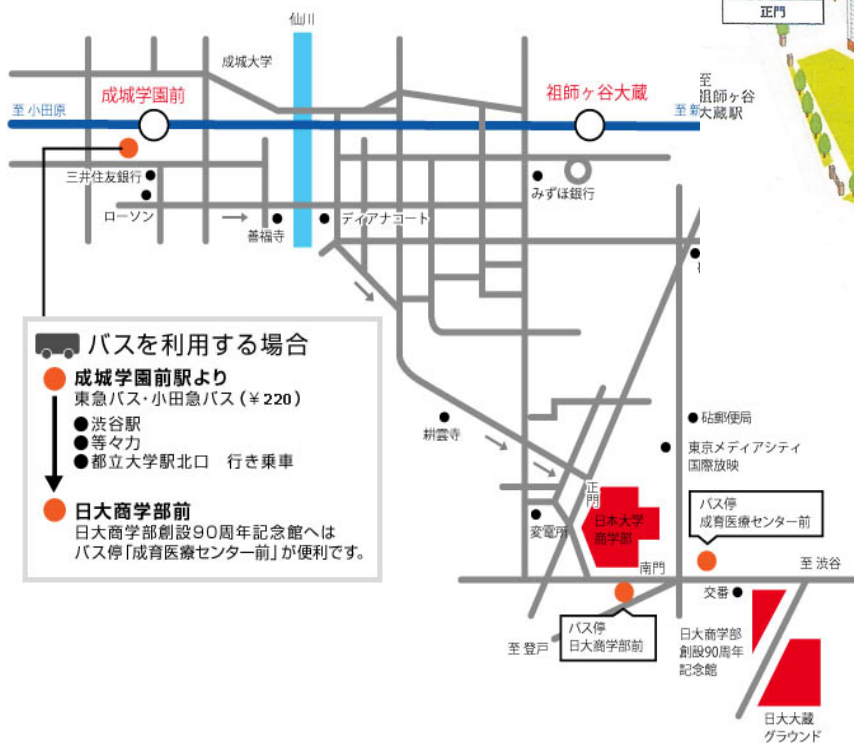
■キャンパスマップ